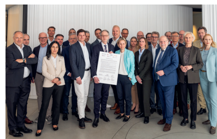
Vertreter der Verlegerverbände am DACHLUX-Treffen 2025 in Zürich

Die Erklärung von Zürich adressiert die Dringlichkeit klarer Spielregeln für die KI-Plattformen, damit journalistische Medien auch in Zukunft ihre demokratiepolitisch relevante Leistung erbringen können.