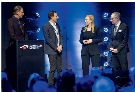
Dreikönigstagung, 9. Januar 2025, AURA Zürich