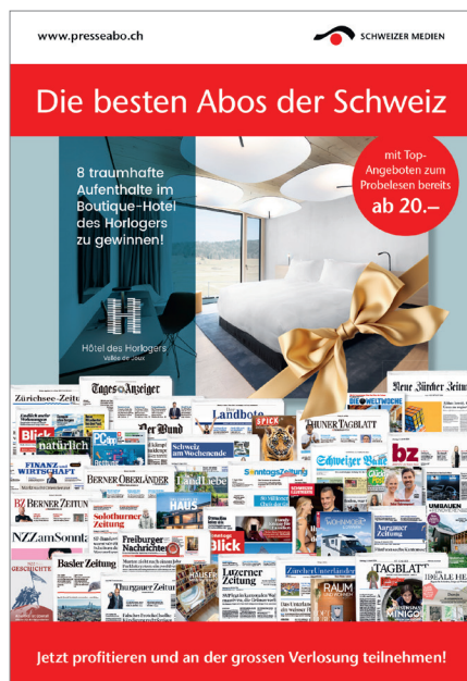
Presseabo: Gemeinsam Abonentinnen gewinnen

Die Werbeaktion erreichte eine Gesamtauflage von 1,68 Millionen Exemplaren, was einem Rückgang von 4 % im Vergleich zum Vorjahr entspricht. Trotz der erneut rückläufigen Auflage konnte die Verbundaktion 6006 Abo-Bestellungen generieren und eine Umsatzsteigerung von 4,7 % erzielen.