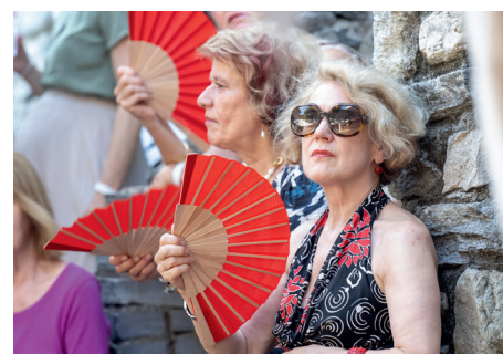
Soirée Médias, 9. August 2025, Teatro Paravento Locarno