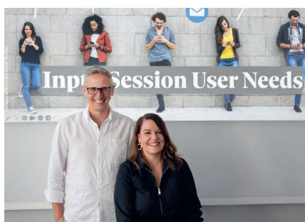
Input Session: User Needs

Zwei Input-Sessions zu den aktuellen Themen KI und User Needs boten direkte Einblicke in die Erfahrungen anderer Medienhäuser, und Fachexpertinnen und Fachexperten vermittelten praxisnahe Umsetzungstipps.